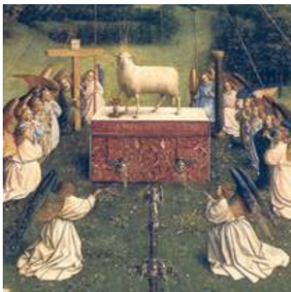
Anbetung des Lammes (Jan van Eyck, Genter Altar, 15. Jahrhundert, Ausschnitt)

Allgemeinen und gegen fromme Pietisten im Speziellen vorzugehen. Sie werden dann in Predigten gerne mit Pharisäern und Schriftgelehrten gleichgesetzt. Das Evangelium, das aus diesem antijüdischen Feindbild erwächst, lautet: Durch Jesus wirst du frei von Gesetzen und Geboten. Du musst dich nicht mehr an Regeln halten. (Die gezähmte Fassung dieses Evangeliums lautet: Du musst zwar nicht, aber du darfst – und willst – und wirst ganz von selbst ...). Jesus und Paulus werden dann zu Vorbildern des Gesetzesbruchs: Sabbathheilungen, die Berührung von Aussätzigen und Unreinen, gemeinsames Essen mit Heiden und Sündern, Gespräche mit Frauen: Das alles, meint man, war im Judentum undenkbar, verboten.